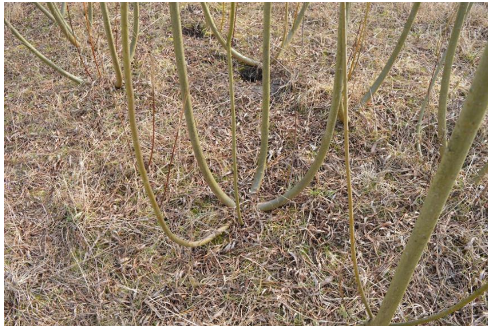
Selekcionēto kārkļu šķirnes