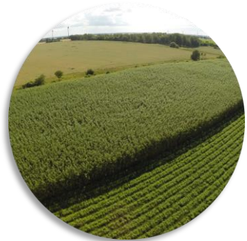
Selekcionēto kārkļu plantācija