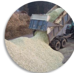
Selekcionēto kārkļu šķelda