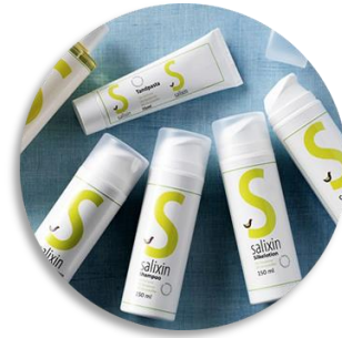
Kosmētikas un medicīnas līdzekļi