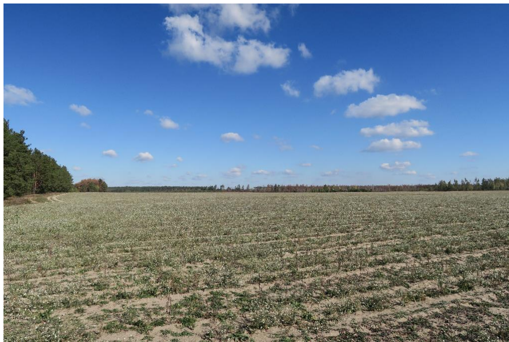
Parastas dabā atrodamas kārķļu šķirnes