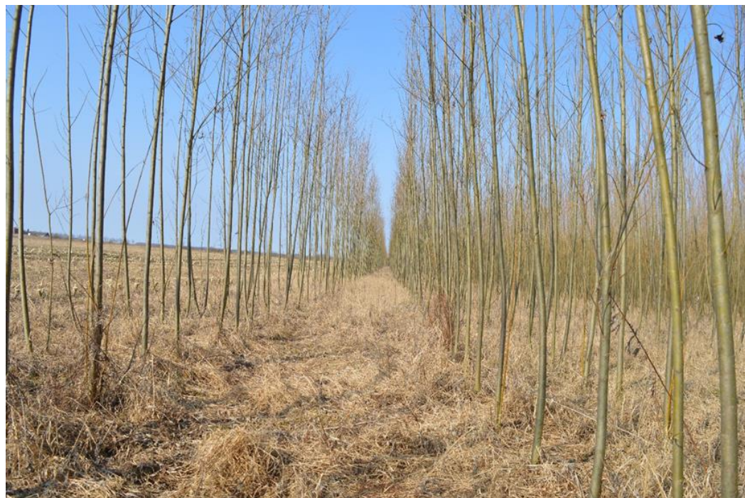
Selekcionēto kārkļu šķirnes