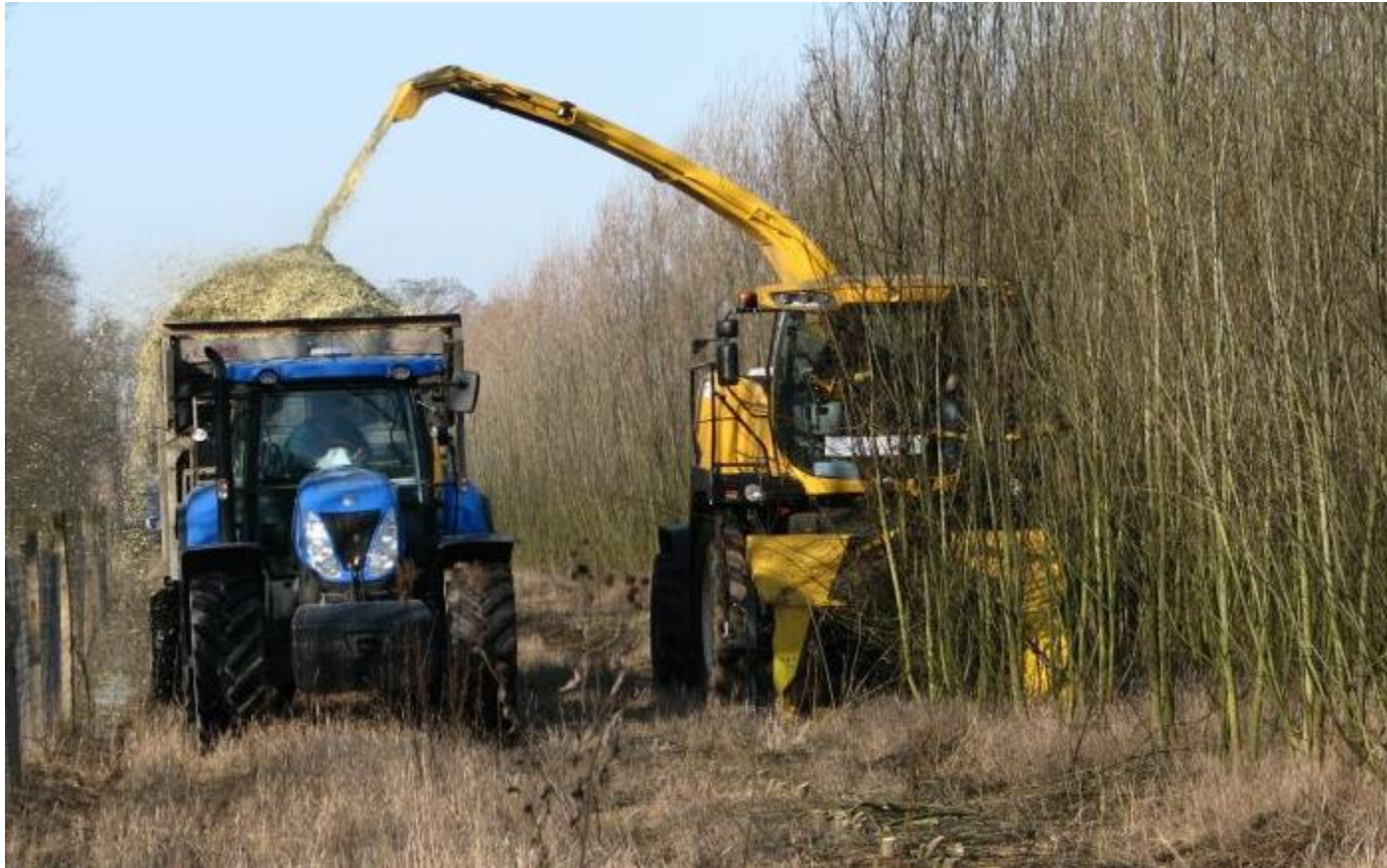
Skizeň RRD včetně štěpkování