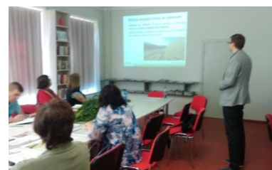
Présentation à Vecpiebalga le 11 mai 2016