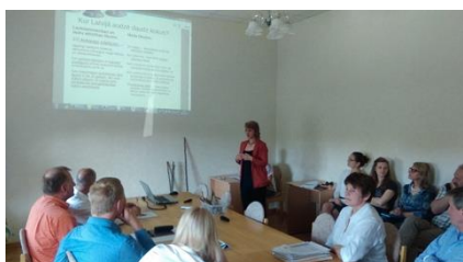
Présentation à la Commission développement de la municipalité de Cēsis le 24 mai 2016

Ekodoma et Saliva ont organisé plusieurs événements afin de promouvoir la production et l'utilisation de TCR, pour avoir de nouveaux contacts, et partager informations et connaissances.